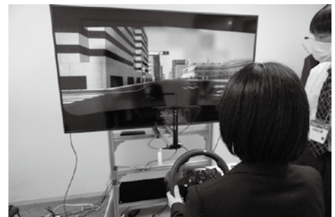
昨年のドライビングシミュレータ体験の様子