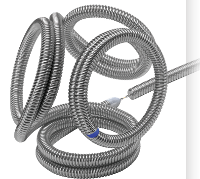
Target Tetra® Detachable Coils

販売名: Target デタッチャブル コイル 医療機器承認番号: 22300BZX00366000